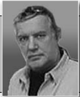
Пише: Небојша Кнежић