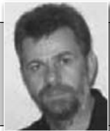
Пише: Драјан Тејавчевић