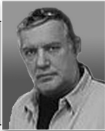
Пише: Небојша Кнежић