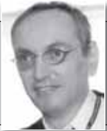
Пише: Миломир Никетић