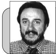
Пише: Небојша Јанковић