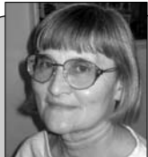
Пише: Сена Тодоровић