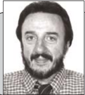
Пише: Небојша Јанковић