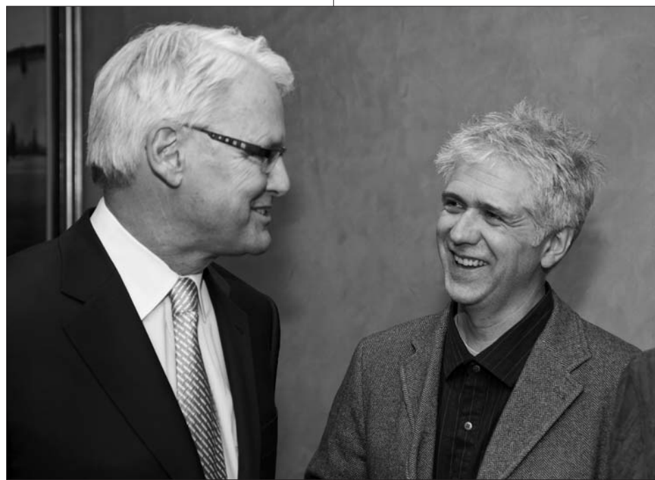
Sa Premijerom Britanske Kolumbije, Gordonom Kembelom