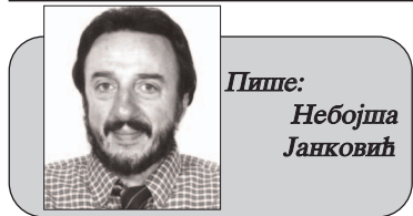
Пише: Небојша Јанковић