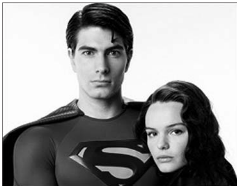
Super-čovek i super-novinarka - Brendon Rut i Kejt Bosvort

men" je bio prvi film koji je publici poručio: "Verovaćete da čovek može da leti!", prodajući uz to i sve ostalo što je išlo sa tim, komotno ostavljajući omađijanim gledaocima neobjašnjena ona logična pitanja poput: "Kako to da niko ne može da primeti prerusavanje Klar-