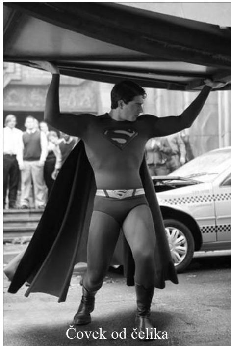
Čovek od čelika

men" je bio prvi film koji je publici poručio: "Verovaćete da čovek može da leti!", prodajući uz to i sve ostalo što je išlo sa tim, komotno ostavljajući omađijanim gledaocima neobjašnjena ona logična pitanja poput: "Kako to da niko ne može da primeti prerusavanje Klar-