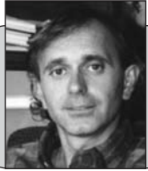
Пише: Бојан Ж. Босилјчић

"Povratak Supermena" ("Superman Returns"), režija: Brajan Singer, glavne uloge: Brendon Rut, Kejt Bosvort, Kevin Spejsi