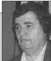
Пише: Љубодраг Стојадиновић